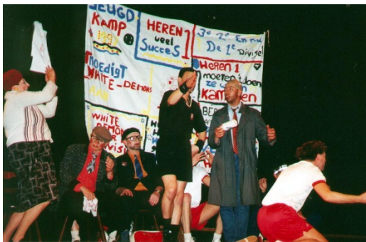
De revue ter ere van het 25-jarig bestaan van HV White Demons

Tijdens een jubileum wordt extra groot uitgepakt. Het 25-jarig jubileum is gevierd met een revue, geschreven en uitgevoerd door de eigen leden. Ook is toen het clublied geboren. Tijdens het 40-jarig jubileum in 2013 waren er vele activiteiten voor de jeugd, het recreatietoernooi en een gezellige barbecue.